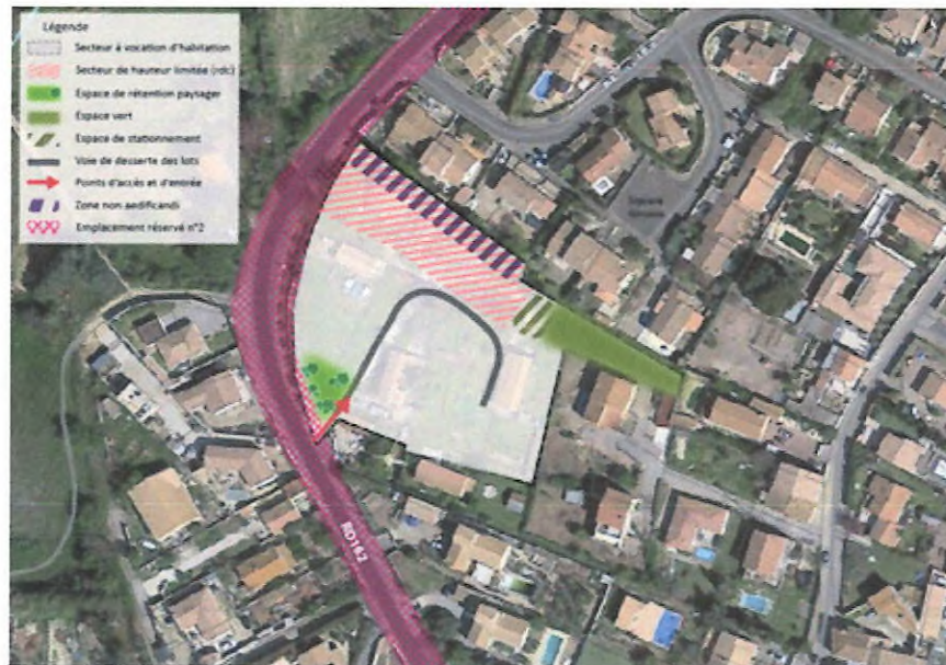
Schéma d'aménagement actuel