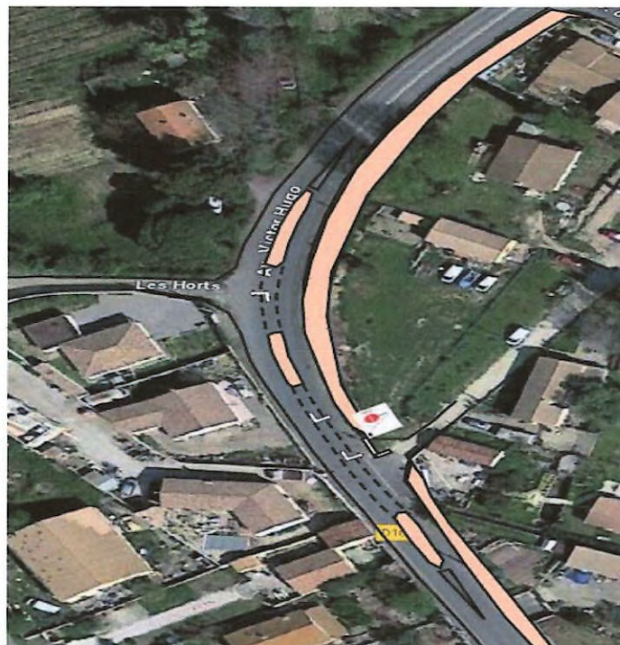
Schéma proposé par l'ATD

La géométrie de ces aménagements sera soumise à validation de nos services et la maîtrise d'ouvrage et les financements de ces coûts d'aménagement seront à la charge du pétitionnaire.